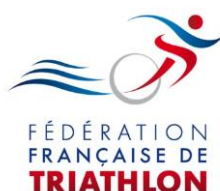
Fédération de Triathlon