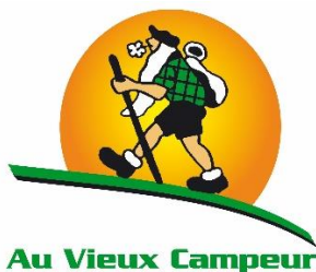
Au vieux Campeur