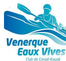
Venerque Eaux Vives