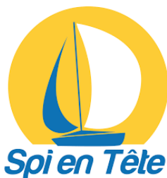
Spi en tête