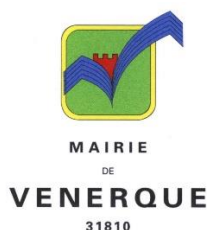
Mairie de Venerque